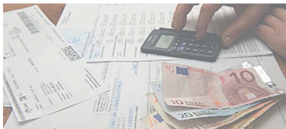
Indice armonizzato dei prezzi al consumo, Istat ottobre 2022